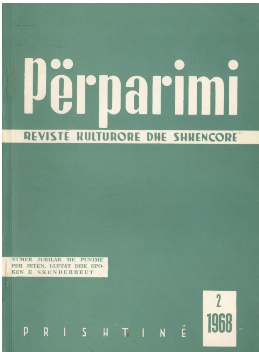
Revista "Përparimi" 1968 nr. 2